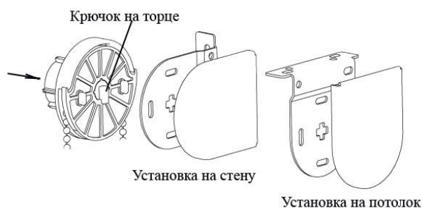
Рис.3. Установка изделия в кронштейны

Кронштейн с крестообразной прорезью должен располагаться с выбранной стороны управления.